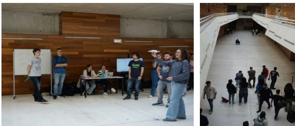
Figura 1. Imágenes de la primera edición del concurso (curso 2023/2024)

Al siguiente año, en el curso 2024/2025, en el marco de la primera edición oficial de este proyecto de innovación se realizó el II Concurso de Aviones de Papel de la Facultad de Educación, con una participación similar a la de la primera edición. Así mismo, según lo establecido en la memoria del proyecto, se llevaron a cabo actividades en las especialidades de Física y Química y de Matemáticas del Máster de Profesorado que mostraban el potencial didáctico de una propuesta educativa alrededor del diseño y prueba de aviones de papel.