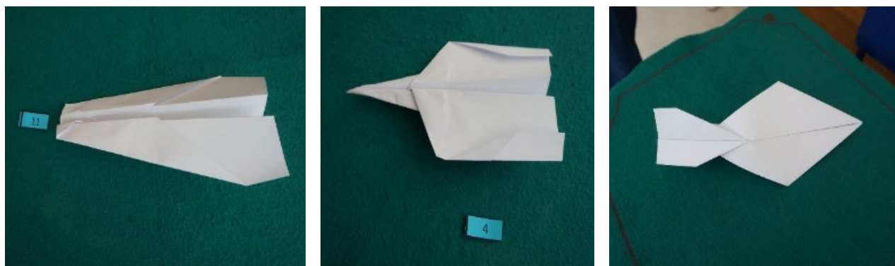
Figura 2. Ejemplos de aviones de los participantes en el concurso

La actividad se estructura en tres fases. En la primera, se plantea el diseño del concurso como propuesta didáctica para secundaria y bachillerato, abordando aspectos como normas, materiales, espacios y contenidos curriculares vinculados a la Física y la Química. En la segunda fase, los grupos construyen prototipos, registran datos de vuelo y justifican sus decisiones, favoreciendo la modelización y la evaluación de evidencias empíricas. La última fase se centra en el análisis crítico y rediseño de la actividad, profundizando en contenidos como la aerodinámica, el centro de gravedad, o las propiedades del material, así como en la complejidad de establecer reglas justas y condiciones experimentales controladas. La experiencia culmina con la colaboración entre especialidades para organizar el concurso en la Facultad de Educación, registrando gráficamente cada modelo y midiendo las distancias alcanzadas (Fig. 2).